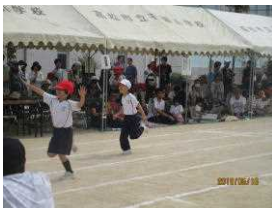
徒競走も一生懸命