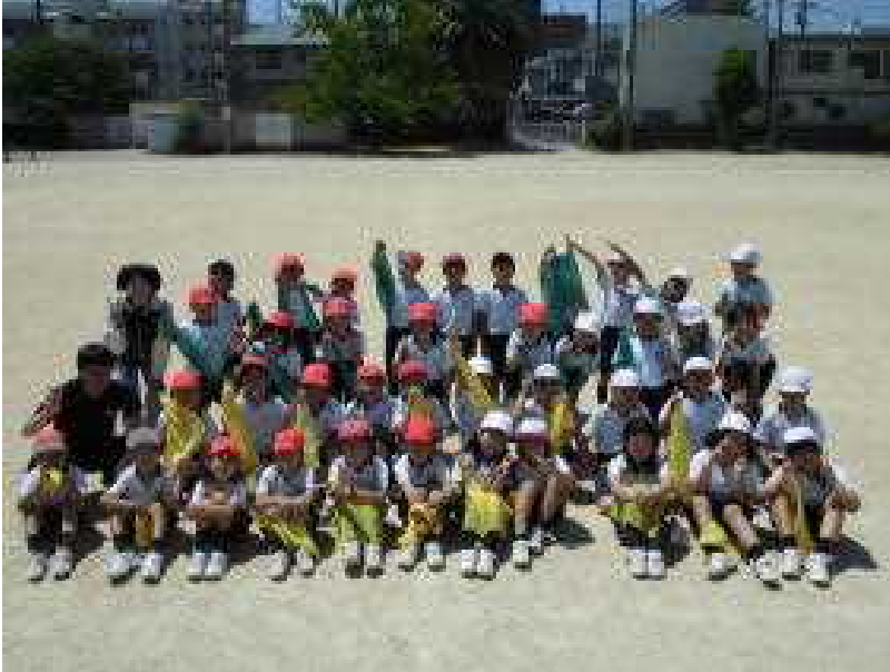
練習の時も楽しく仲良く頑張りました

毎日の練習を通して、たくましく成長することができました。また、グループで話し合い表現を考える活動では、きずなを深めることができました。