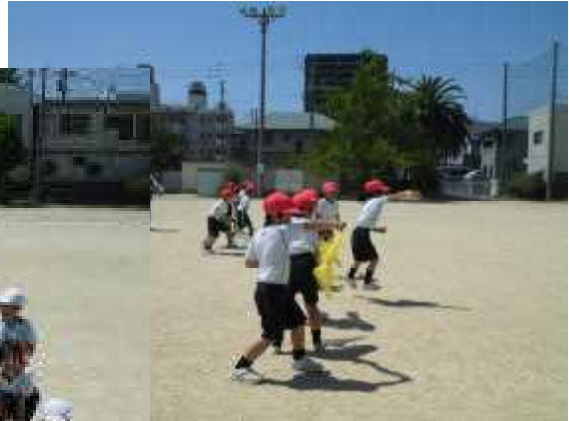
敵と戦う激しい場面です